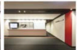
view D カンファレンスルーム専用エスカレーターを上ると左手に受付があります。