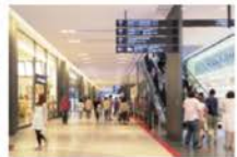
view A 北館に入ると正面に誘導サインが掲示されています。[カンファレンスルーム タワーB] を目指してお進み頂き、[タワーB オフィスエントランス] にお入り下さい。