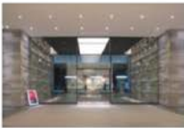
view D タワーB オフィスエントランスに入り、シャトルエレベーターで9Fスカイロビーに上がります。