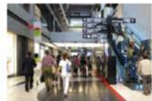
view A 北館に入ると正面に誘導サインが掲示されています。[カンファレンスルーム タワーB] を目指してお進み頂き、[タワーB オフィスエントランス] にお入り下さい。