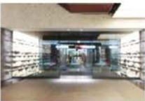
view D タワーB オフィスエントランスに入り、シャトルエレベーターで9Fスカイロビーに上がります。