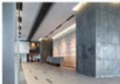
view A 9F スカイロビーでエレベーターを降り左手 [TULLY'S COFFEE] 方向に進みます。