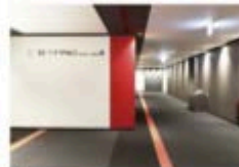
view C 併からカンファレンスルーム専用エスカレーターで10Fへ。