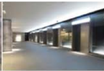
view C タワーB オフィスエントランスの向かいには [Samsonite Black Label] です。