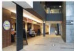
view B [TULLY'S COFFEE] 右手のカンファレンスルーム専用エスカレーターで10Fへ。