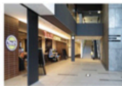
view B [TULLY'S COFFEE] 右手のカンファレンスルーム専用エスカレーターで10Fへ。