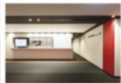
view D カンファレンスルーム専用エスカレーターを上ると左手に受付があります。