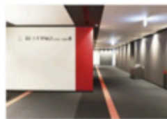
view C 駅からカンファレンスルーム専用エスカレーターで10Fへ。