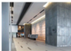
view A 9F スカイロビーでエレベーターを降り左手 [TULLY'S COFFEE] 方向に進みます。