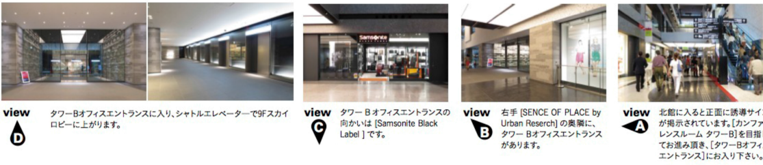
view D タワーBオフィスエントランスに入り、シャトルエレベーターで9Fスカイロビーに上がります。