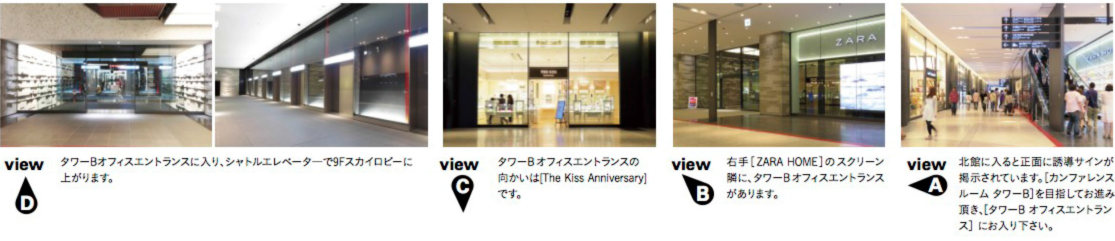
view D タワーBオフィスエントランスに入り、シャトルエレベーターで9Fスカイロビーに上がります。